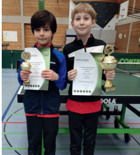
Toller Erfolg beim Bezirksranglistenturnier