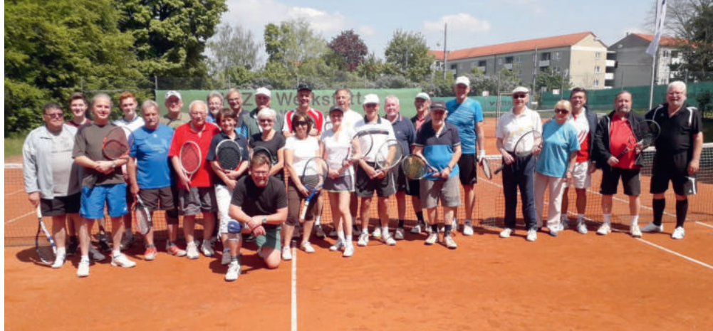
Die Abteilungsleitung freut sich über die hohe Teilnehmerzahl