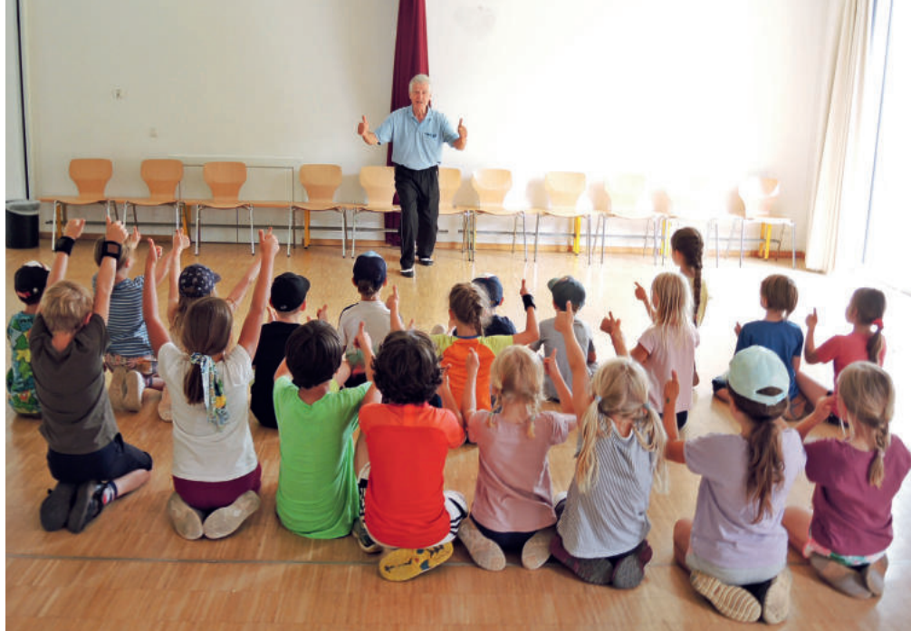
Rhythmus – Takt